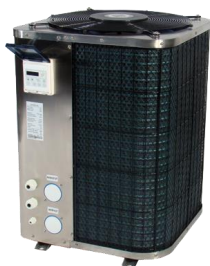
Gullberg & Janssons vertikala poolvärmepump

Gullberg & Jansson marknadsför Nordens mest sålda poolvärmepump, en egendesignad vertikal poolvärmepump med hög verkningsgrad och robust kvalitet. Den vertikala pumpen levereras i ett rostfritt skal, samt med display med diverse inställningsfunktioner. Det vertikala luftutblåset gör poolvärmepumpen lättare att placera då den inte kräver samma utrymme som en horisontell poolvärmepump.