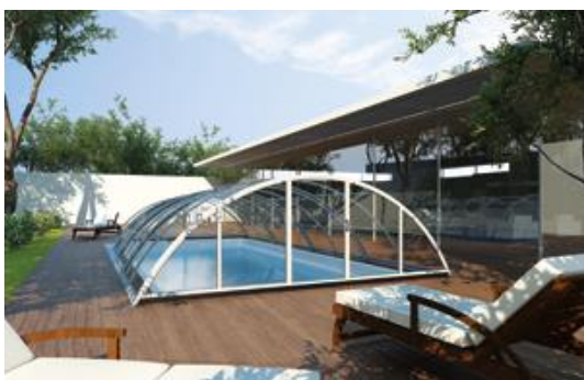
Pooltaksmodellen Stella erbjuds i vit färg eller i aluminium.

Gullberg & Janssons pooltak har lång livslängd tack vare robusta konstruktioner, förstärkta aluminiumprofiler och paneler med UV-skydd på båda sidor. Samtliga modeller har mjuka och behagliga linjer och är designade för att dölja nitar och rostfria skruvar i största möjliga utsträckning samt har stabila lösningar för utsatta funktioner som lås och gångjärn.