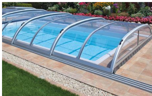
Pooltaksmodellen Nova är marknadens mest sålda pooltak och ett av marknadens lägsta pooltak

Våra två standardserier av pooltak – Nova/Stella och Nova Comfort/Stella Comfort – har dessutom utformats för att passa alla standardpooler, både med och utan poolsarg. Pooltaken har utbyggbart skensystem som är permanent vindsäkrat och pooltakens hjul har dammtäta kullager i specialstål för att minimera rullmotståndet.