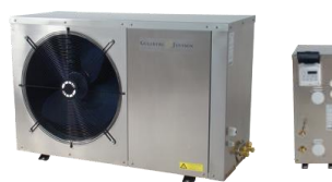
En splitmodell, till vänster visas utomhusdelen och till höger inomhusdelen

För inomhuspooler marknadsför Gullberg & Jansson ett splitsystem som består av en värmeväxlare och en styrenhet inomhus samt en gaskopplad utomhusdel för att hämta energi från utomhusluften. Värmeväxlardelen placeras inomhus vilket innebär att inget vatten är utomhus och därmed elimineras frysrisk.