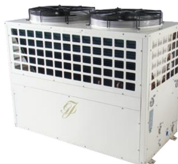
Poolvärmepump för större badanläggningar

Gullberg & Jansson erbjuder poolvärmepumpar för stora offentliga anläggningar såsom offentliga utomhusbad, vattenland, campingplatser, hotell, spaanläggningar och simhallar. Enheterna kan enkelt kopplas samman för att tillgodose ett större effektbehov. För kunderna innebär poolvärmepumpar ett ekonomiskt alternativ både som totallösning och som komplement till en annan värmekälla.