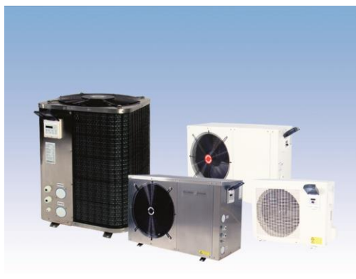
Gullberg & Janssons olika serier av poolvärmepumpar för privata swimmingpooler

Gullberg & Jansson utvecklar och marknadsför ett brett sortiment av prisvärda och väldesignade kvalitetsprodukter inom swimmingpool & spa med fokus på poolvärmepumpar och pooltak. Samtliga produkter är anpassade till nordiska klimatförhållanden. Övriga produkter i sortimentet inkluderar poolvärmeväxlare, avfuktare till inomhuspool och tillbehör. Gullberg & Jansson har en uppskattad supportorganisation och servicenätverk på de marknader som Bolaget agerar på, vilket säkerställer högklassig service och god produktfunktion över tiden.